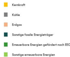
Umweltauswirkungen je Kilowattstunde